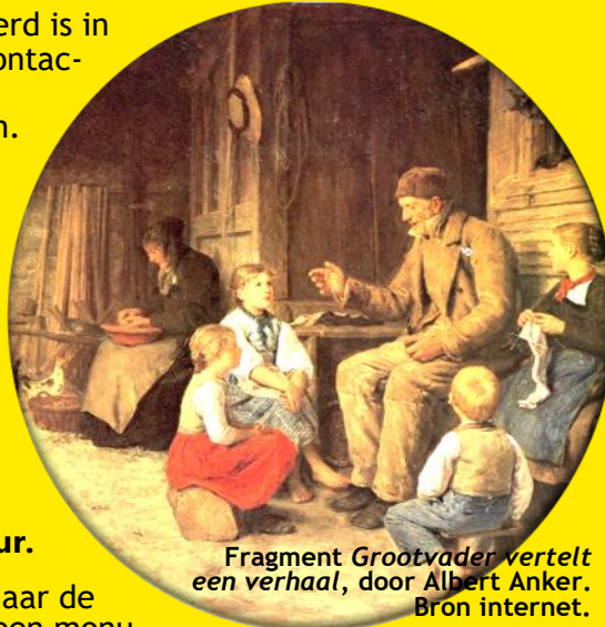
Fragment Grootvader vertelt een verhaal, door Albert Anker.

Langs gaan op de bonnefooi mag, maar toegang is dan niet zeker.