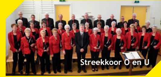
Streekkoor O en U

Gemengd zangkoor O en U geeft enkele korte concerten: